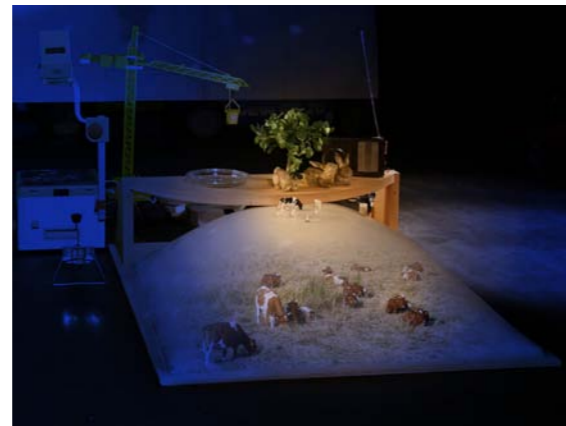
Maquette de la scénographie du spectacle 1-2-3 SOLEIL en cours de réalisation