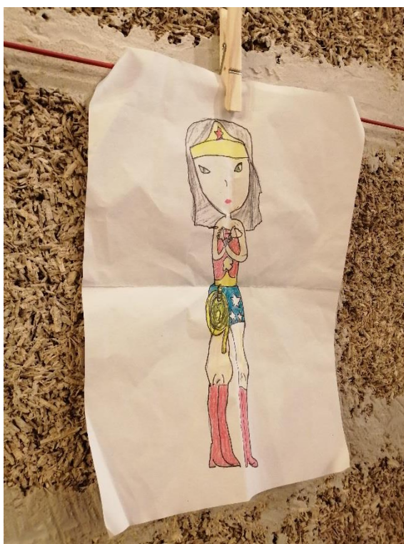
Les dessins de Mouche : Wonder Woman © D.R.

NOTA BENE : les droits d'auteur (droits SACD) de Tata Moisie sont à la charge de l'organisateur.